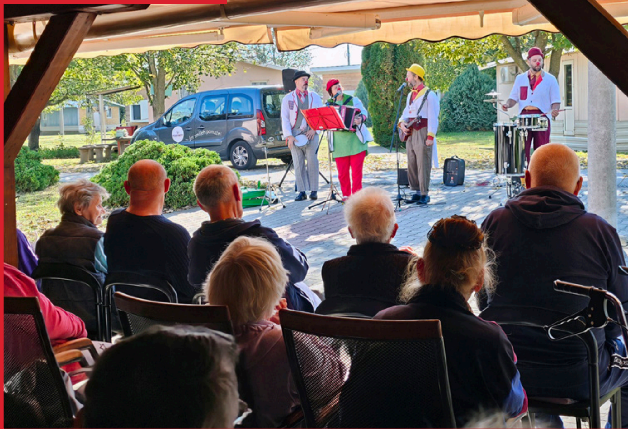
Dom za starije i nemoćne u Iloku

Zapljeskali su im i počeli se ustajati kao da odlaze. Naši klaunovidoktori su ostali u čuđenju, dok se korisnici nisu nakon dva tri koraka okrenuli i rekli: „Aaaa, jesmo vas, ha?“ i vratili se na svoja mjesta, te uživali u vječnim šlagerima našeg klaunovskog benda. Osoblju Doma zahvaljujemo na gostoprimstvu.